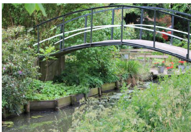
Hoge brug langs de Parallelweg

Zie het plan voor de nieuw te bouwen wijk in Boven-Hardinxveld: Tienmorgen-Noord, simpel gezegd op de locatie waar nu de Tiendwaert staat. Met deze wijk probeert men 'een verzorgd, samenhangend en eenduidig, groen-natuurlijk eindbeeld' te realiseren.