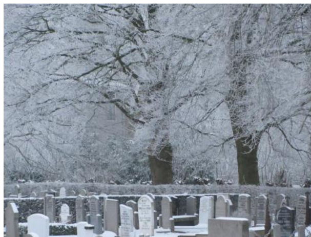
Zelfs het kerkhof is mooi zo!