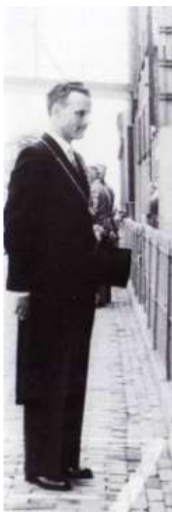
Burgemeester Brinkman in al zijn waardigheid

Het is toch nog steeds 'het burgemeestershuis', de ambtswoning. Alleen dat woord al wekt ontzag op. En het huis zelf, op die centrale locatie in het dorp, doet de rest. Een toch wel statig pand!