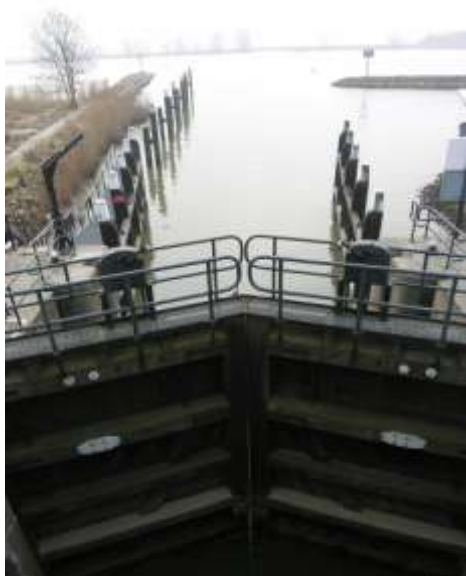
Een ommetje via de Peulensluis