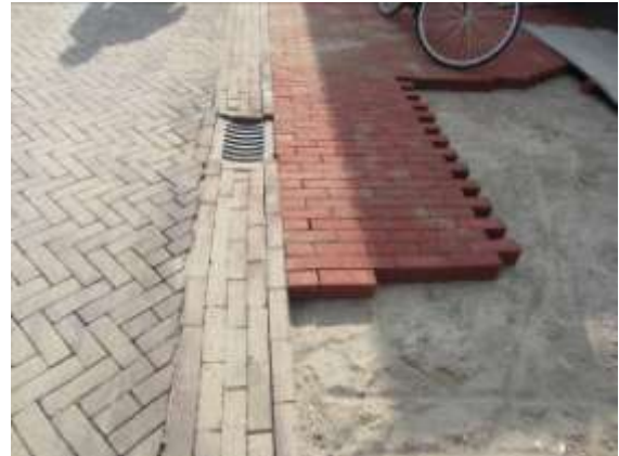
Het recente beeld in de Peulenstraat