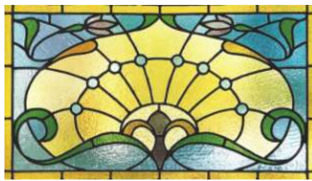
Een jugendstil-raam op Damstraat 36

Ook in ons dorp zijn bij woonhuizen voorbeelden van jugendstil te vinden. Soms zeer overtuigend, soms in afgeleide vorm. Bijzonder zijn enkele glas in lood ramen en hekwerken. Op de foto treft u daarvan een voorbeeld aan.