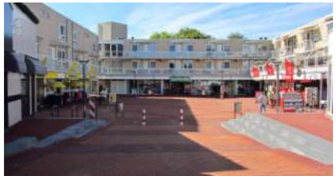
Opgeknapt! Nu de bomen nog.

onderdoor loopt. Dat hoeft toch niet. Dat ziet toch iedereen; daarom is destijds ter plekke open hekwerk geplaatst in plaats van de bestaande muurtjes. Dan kun je de Giessen zien. En dat rood van de straatstenen had best wat dieper rood mogen zijn. Maar al met al is het een heel stuk opgeknapt. Nu nog nieuwe winkels in de panden die staan weg te kwijnen. Want ook in ons dorp is de krimp merkbaar... Een nieuwe boeiende taak voor het gemeentebestuur om die weer vol te krijgen. Dan wordt de Peulenstraat nog mooier.