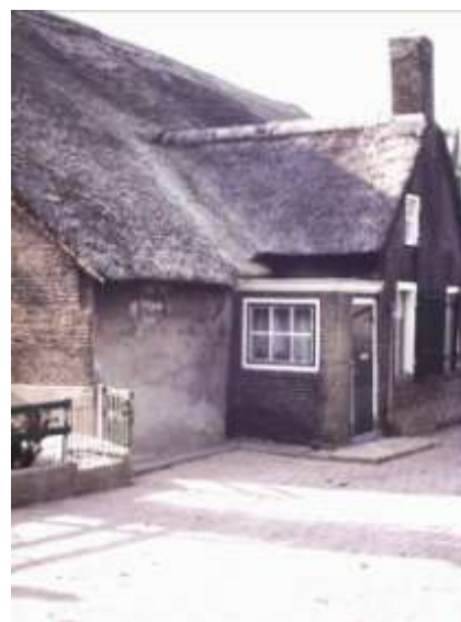
Binnendams 26, zo'n 50 jaar geleden

Hij maakte er een fraai pand van, dat past in de resterende stukjes boerderijlint, die Binnendams nog rijk is. In de laatste fase van de herbouw maakte Boerderij & Erf Alblasserwaard-Vijfheerenlanden nog gebruik van het achterhuis voor het houden van een symposium. Dat werd ook bezocht door deskundigen uit het hele land, die waarderende woorden lieten horen over het initiatief voor de herbouw en restauratie en voor de moed en durf die daarbij nodig was. Ook bewondering voor het feit dat de financiering uit eigen middelen rond was gekomen.