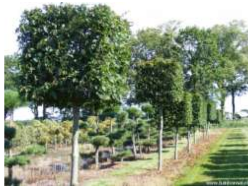
De haagbeuk kan in allerlei vormen gesnoeid worden

Onder meer de appelvink en de boomklever zijn in de herfst dol op de zaden van de haagbeuk. Ook bosmuizen en hazelmuizen doen zich vaak te goed aan de nootjes van de haagbeuk.