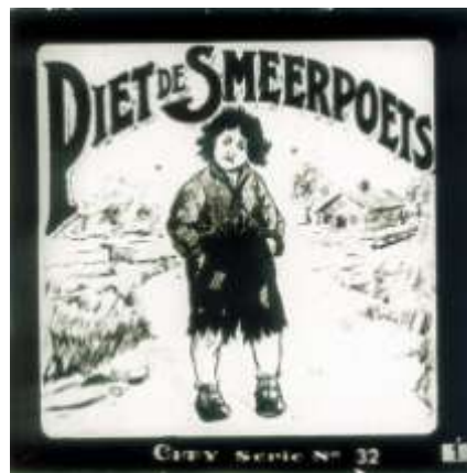
Het toonbeeld van een bonsem

Het werkwoord is overigens afgeleid van het woord bonsem, wat 'bunzing' kan betekenen of 'ruwe ke-rel'. Een vuilak, of, zoals mijn vader ook wel zei, een 'echte onterik'.