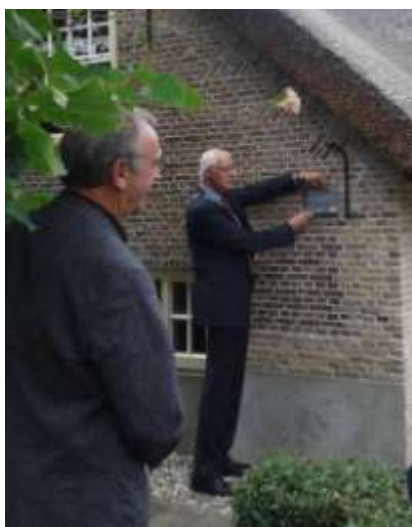
Het officiële moment