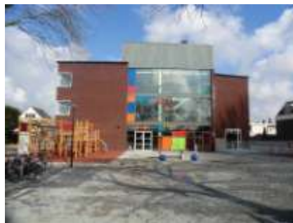
De nieuwe Koningin Wilhelminaschool ligt op de route

Een voorbeeldwandeling: start bij het gemeentehuis, loop Peulenstraat-Zuid door (daar staat links en rechts best nog leuke bebouwing), na het passeren van het viaduct over de rijksweg gaat u rechtsaf het fietspad op langs de A15 (u ziet de rivier en de uiterwaarden erlangs). Bij de rijkswegsluis loopt u de trap af en gaat u onder rijksweg door (op zich al een belevenis). Aan de andere kant loopt u door de Merwedestraat (langs het park) weer terug naar het gemeentehuis.