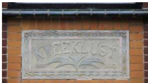
De gevelsteen boven de voordeur

Er zullen niet veel Hardinxvelders zijn die het pand op Parallelweg 19 niet kennen. Een fraai, statig huis, gescheiden van de weg door een brug en heuse oprijlaan omzoomd door mooie oude bomen. Een van de laatste juweeltjes in ons dorp. Minder bekend misschien is de naam die op een gevelsteen ingemetseld boven de voordeur prijkt: Kweeklust.