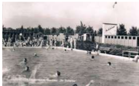
Zwembad de Duikelaar rond 1965

Zo'n kleine 60 jaar heeft ons dorp een echt buitenzwembad gehad. Op 22 april 1955 werd het officieel door burgemeester De Boer geopend. Zo'n 20 jaar later spetterde ik er vrolijk rond. En of het ook toen nog goed gebruikt werd! Zoals zovelen kreeg ik een 'abbrement' en was er met mooi weer vrijwel dagelijks te vinden. Soms wel 2 of 3 keer per dag. Op de fiets naar de Sluisweg en dan door de controle. Daar zat altijd een mevrouw achter het glas ijverig te breien. Zij wierp een blik op het abonnement, drukte op een soort knopje en breide gestaag door. Ik kan haar nog bijna zo uittekenen. Dan door naar de kleedhokjes. Altijd een spannende bezigheid, omdat je goed moest opletten of de deur wel goed sloot. Bovendien was er veel open ruimte boven en onder de tussenschotten, wat heel wat gegluur en vervolgens gegil uitlokte. Dus rap-rap omkleden, desnoods met je handdoek om je heen geslagen. Had je dat gedeelte goed doorstaan dan snel naar het zwembad. Onderweg passeerde je nog een koude douche en een blauw voetenbad, die de laatste hinderpaal vormden voor het eigenlijke doel: een van de drie baden met koel, verfrissend water en een hele meute vriendinnen.