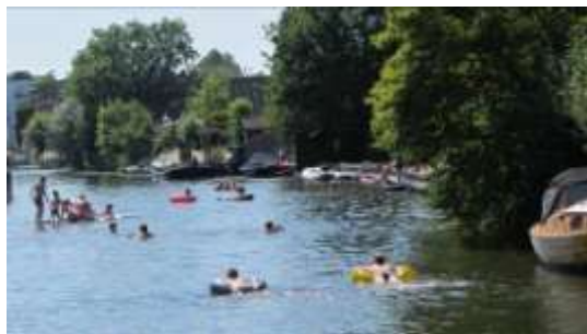
Zomerse waterpret in de Giessen tussen de Kerkweg en Damstraat

Maar ook dat fenomeen is, voor zover ik er van weet, nog van vrij recente datum. Pas van de laatste, pakweg, 8 jaar. Daarvoor loosden er nog diverse rioleringen op de Giessen, waardoor het niet echt fris was om een duik te nemen. De laatste jaren echter is de waterkwaliteit zodanig dat het weer kan, zwemmen in de Giessen. Heerlijk toch, vooral als je aan de Giessen woont! En: heerlijk toch, nu het buitenbad van de Duikelaar sinds een paar jaar gesloten is! Want waar zou je anders moeten zwemmen in Hardinxveld als al dat buitenwater er niet was?