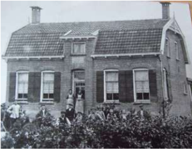
Kweeklust in zijn beginjaren. Op de voorgrond het personeel

Overigens was het niet de enige groentekwekerij aan de Parallelweg. Ook bijvoorbeeld het perceel links ernaast herbergde er één en aan de andere kant was de kwekerij van gebroeders Van Iperen, die hun waren met paard en wagen (later een tractor) bij klanten aan de deur uitventten.