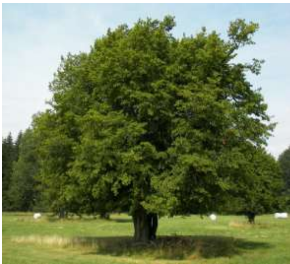
Een natuurlijke haagbeuk

De boom is autochtoon en komt in het wild voor in West-, Midden- en Zuid-Europa en in West-Azië. Plaatselijk is de haagbeuk algemeen in (Nederland): in Limburg (Zuid-Limburg), delen van Gelderland en delen van Noord-Brabant (de Kempen). Ook het zuiden van West-Vlaanderen kent nog vele natuurlijke haagbeuken.