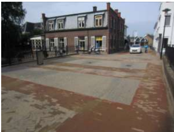
De Dam in nieuwe verschijning

Al weer een flinke tijd terug ontstonden de eerste plannen om de Peulenstraat te gaan herstraten. Bij de voorbereiding hiervan is Stichting Dorpsbehoud Hardinxveld-Giessendam nadrukkelijk betrokken geweest. Ons advies is gevraagd, gewaardeerd en op een aantal belangrijke onderdelen meegenomen. Wij hebben vooral gevraagd om rust. Geen wirwar van kleuren, maar een terugkeer naar rustig rood voor de klinkers en hardsteenkleurig grijs voor de rest. En geen palen. Van die laatste is er een enkeling geplaatst. Een bescheiden paal, die nu wel past in het geheel.