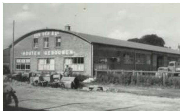
Van der Aa's Houten Gebouwen

Rechts in de Troelstrastraat was een klein bedrijventerrein. Daar waren twee ketenbouwers gevestigd, Van der Aa en Van 't Verlaat. Giessendam kende heel wat bedrijven in die branche. Ze waren ontstaan, toen de hoepelmakerijen niet meer rendeerden. Aan houten keten kwam behoefte in de aannemerij. Overal waar gewerkt werd waren verblijfsruimten, als kantine, als kantoor of als wat anders, nodig.