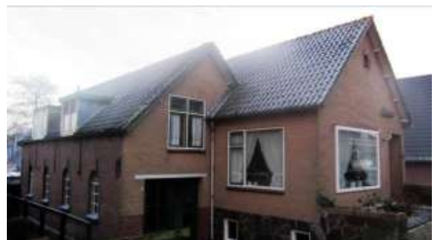
Links de oude hoepmakersschuur en rechts het nieuw gebouwde gedeelte van 'Orana'

Het pasgetrouwde koppel Van Noordenne vindt een noodgedwongen, maar mooi onderkomen op de zolder van de hoepmakersschuur naast het ouderlijk huis van de bruidegom. Dat is op Buitendams 335. Als de ouders overlijden, besluit hij nieuw te bouwen, maar wel op de fundamenten van het oude huis. Op een zaterdag gaan daarom 4 zwagers met elkaar aan het breken; het puin laten ze door boeren afvoeren voor verharding van hun paden.