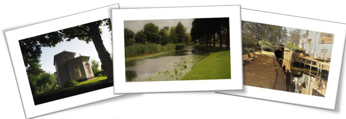
Groeten uit Hardinxveld- Giessendam!