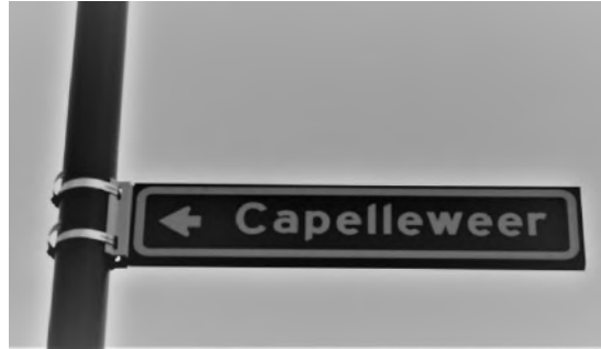
De Capelleweert, een doodgewoon straatje met een enigszins mysterieuze naam

In de Wielwijk tref je veel straatnamen aan met de uitgang 'weert'. Van waar die benaming? Een stukje geschiedenis.