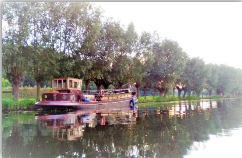
Nostalgie op de Giessen

WILT U DE NIEUWSBRIEF OOK GRATIS ONTVANGEN?