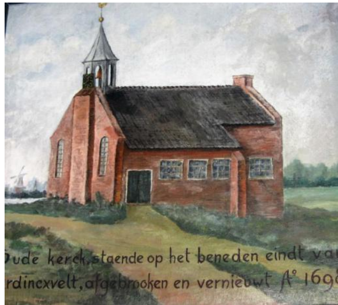
Schilderij van de kapel 'op het beneden eindt van Hardinxveld'

Wat echter niet verdween zijn de namen van diverse weren in en rond ons dorp. Neem bijvoorbeeld de Capelleweer. In de buurt van de sluis tussen het Kanaal van Steenenhoek en de Merwede lag het oude Comen Reyertsweer. Op een kaart uit 1652 wordt het Capelleweer genoemd, waarschijnlijk omdat het in die tijd in bezit geweest zal zijn van de diakonie van Neder-Hardinxveld. Het hoorde namelijk toe aan de kapel 'op het einde van Hardinxveld', waar later de Hervormde kerk in de Peulenstraat werd gebouwd.