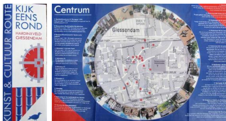
De Kunst & Cultuurroute in concept

Op dinsdag 12 september 2017 wordt de route officieel geopend door mevrouw T.(Trudy) Baggerman, wethouder Welzijn, Sport en Cultuur. Verder wordt de mooi vormgegeven Kunst & Cultuurroute o.a. gepresenteerd tijdens het HAGI-festival bij de Koperen Knop op 30 september a.s.