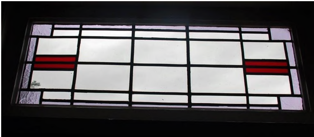
Ook in Hardinxveld-Giessendam zijn boven deuren en ramen bijzonder fraaie glas in lood ramen te zien. Enkele zijn hier afgebeeld. Ook die zijn het behouden waard. Kleine monumenten!

In Nederland zijn de Renaissance ramen nog volop aanwezig, bijvoorbeeld de beroemde ramen van de St. Janskerk in Gouda.