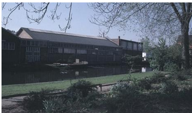
De Hahbo (houtbouw) gezien vanaf de Damstraat.

kinderen. Kwam je er aan de deur, dan ging je nooit zonder snoepje weg. Nog een bijzonderheid: haar piepkleine, ei-gele Fiat 500 , 'het eitje'. Alsof ze hem op de naam uitgekozen had!