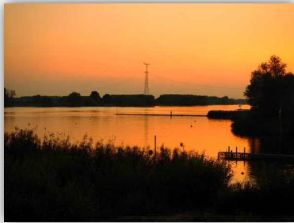
Fraaie zomerse zonsondergangen boven de Giessen en de Merwede