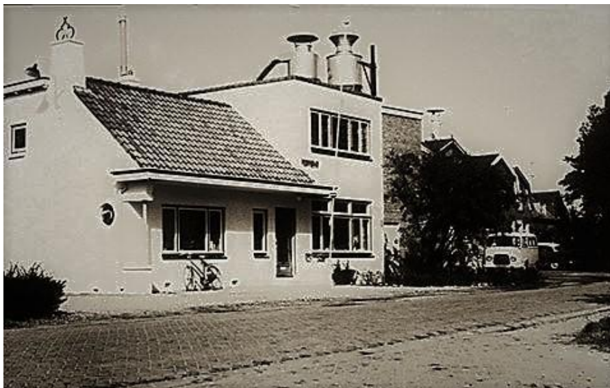
Het kantoor van de Hahbo midden tussen de bedrijfshallen èn midden op de Kerkweg

Maar voor ons, bewoners van de Kerkweg, houdt dat toch meer in. Althans, voor mij persoonlijk (en dan wat dramatisch gesproken) is het toch een soort afsluiting van een stukje van mijn leven.