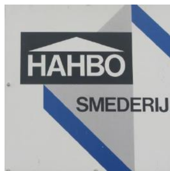
Logo van de Hahbo Houtbouw en Smederij

De Hahbo is verhuisd. De smederij die al jaren gevestigd was op de Kerkweg. Een mededeling waarbij velen de schouders op zullen halen: nou, èn?