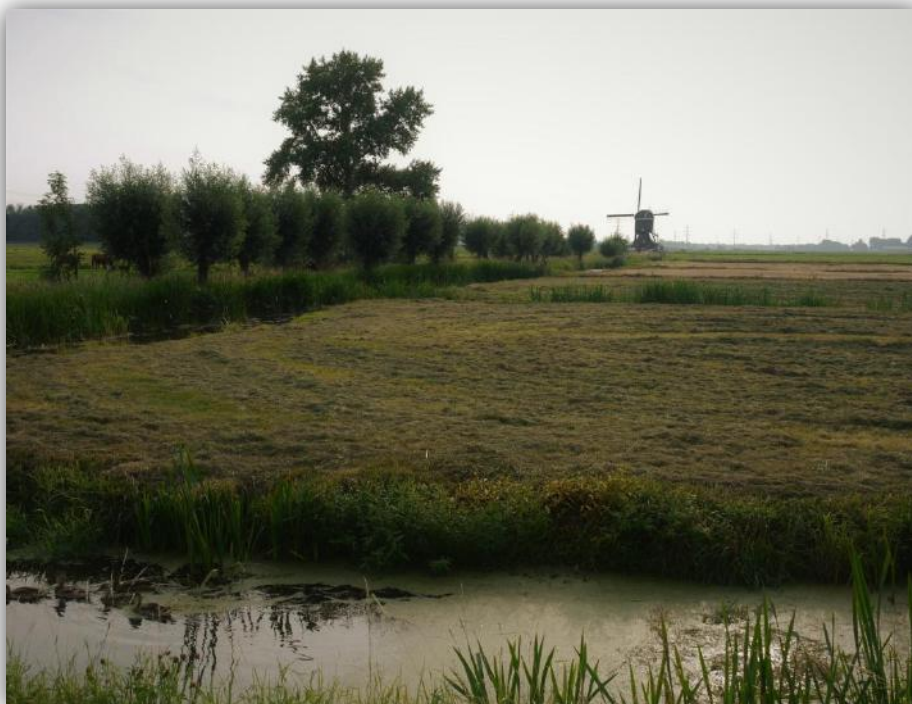
Hooi op het veld, een molen in de verte: puur zomers, puur hollands. Puur Hardinxveld-Giessendam!