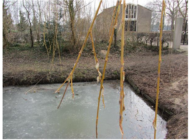
Met de sporen van de winter op het land en ijs in de sloot ontp(rop)pen de katjes zich uit hun warme behuizinkjes.