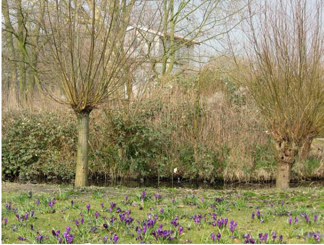
De lente komt eraan... volgens deze krokussen.