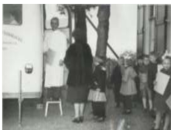
De schooltandarts, een schrik voor menig kind en daarom 'de Berenbijter' genoemd.

Zo ook hier. Bovenstaand een foto van de bus van de Schooltandzorg. In het kader van een betere volksgezondheid heeft de overheid ergens in de jaren vijftig besloten dat er een schooltandarts moest komen. Dat gebeurde vooral ook omdat de tandarts nog een dure voorziening was en omdat preventieve controle hoge kosten in de toekomst zou kunnen voorkomen. Als op de scholen het moment was aangebroken dat de tandartsenbus kwam, dan werd dat door de leerkracht aangekondigd. In de praktijk leidde dit bij een flink aantal kinderen tot de nodig zenuwachtigheid en angst.