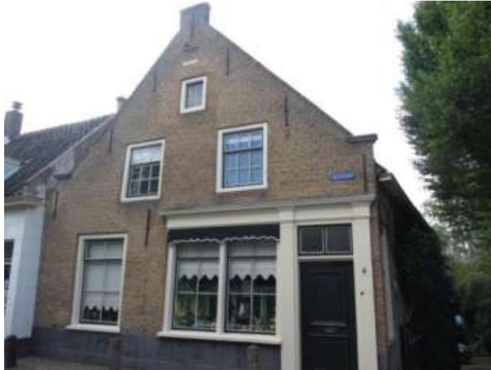
Buitendams 4, op de nipper gered van de slopershamer

1979. De Historische Vereniging van Hardinxveld-Giessendam maakt zich ernstige zorgen over de voornemens van de gemeente een pand in Buitendams te slopen. Het betreft nummer 4, een karakteristiek, eeuwenoud pand, dat jarenlang de bakkerij van Giessendam was. De vereniging brengt zelfs een boekje uit over de geschiedenis ervan en is van mening dat dit pand behouden moet blijven voor ons dorp.