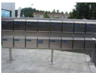
De brievenbussen op het plein voor Peulenstraat 154 markeren niet alleen de grote hoeveelheid voorzieningen in het gebouw er achter, maar ook de verandering van communicatie: steeds meer schriftelijk.

Eerder in dit artikel werd met de schooltandarts een stukje volksgezondheid genoemd. Ook die volksgezondheid is heden ten dage volledig vernieuwd. Dat blijkt uit de batterij hier afgebeelde brievenbussen.