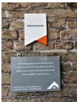
Buitendams 4, zowel gemeentelijk – als rijksmonument

Korte tijd later wordt de Historische Vereniging Hardinxveld-Giessendam opgericht. Voor deze vereniging is het duidelijk dat dit pand het enige, nog vrijwel ongeschonden element was dat deel had uitgemaakt van de herbouwde dorpskern van Giessendam na de grote brand in 1777. Bovendien heeft het een beeldbepalend karakter in de dorpskern.