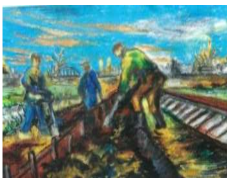
De baas laat zien hoe het tussen de laagbouwkasten toegaat, terwijl de knechten in ketelpak (zoals een overall hier nog steevast wordt genoemd) toekijken. Op de achtergrond, voor de herkenbaarheid van de plaats de boogburg.