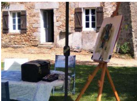
Lekker schilderen in de buitenlucht

€ 10,- per deelnemer. Daarvoor krijgt u een gratis doek (24x30 cm of 50x60 cm) en een broodjes-lunch en consumpties tijdens het festival.