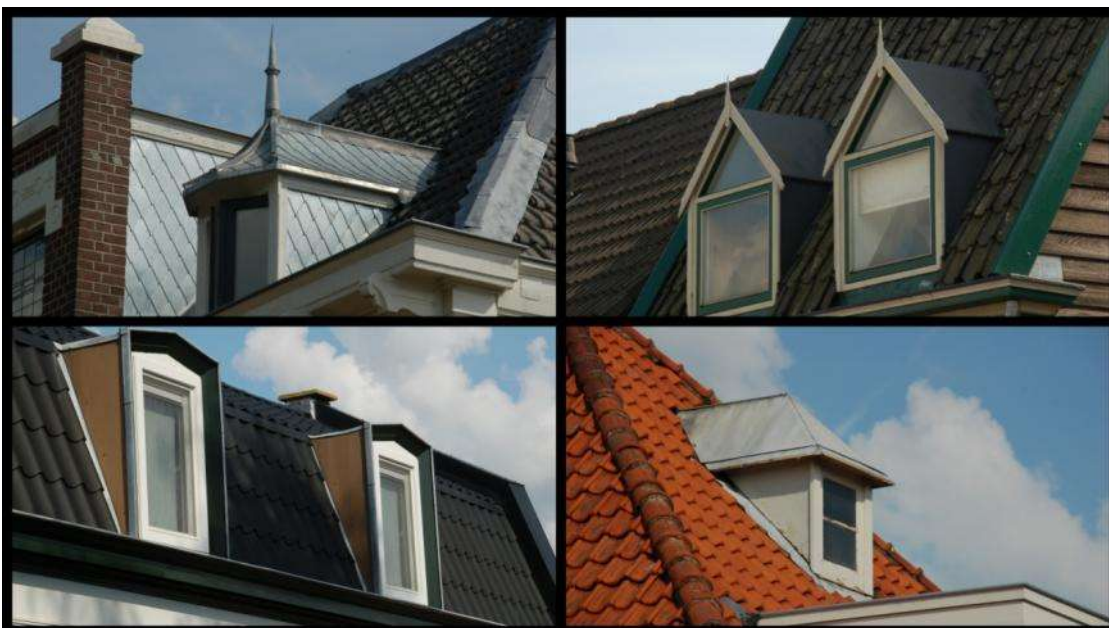
Wie goed koekeloert, ziet hier en daar een koekoek op het dak. Bijvoorbeeld in Binnen-en Buitendams.