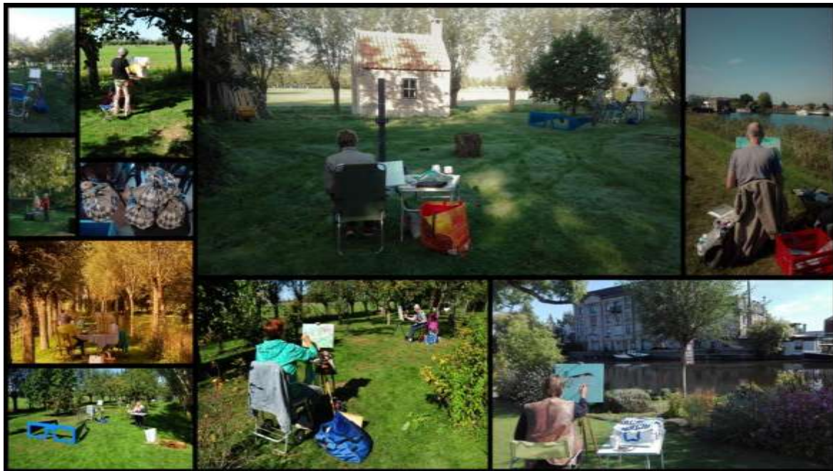
Een fotoverslag van de Pintar Rapido