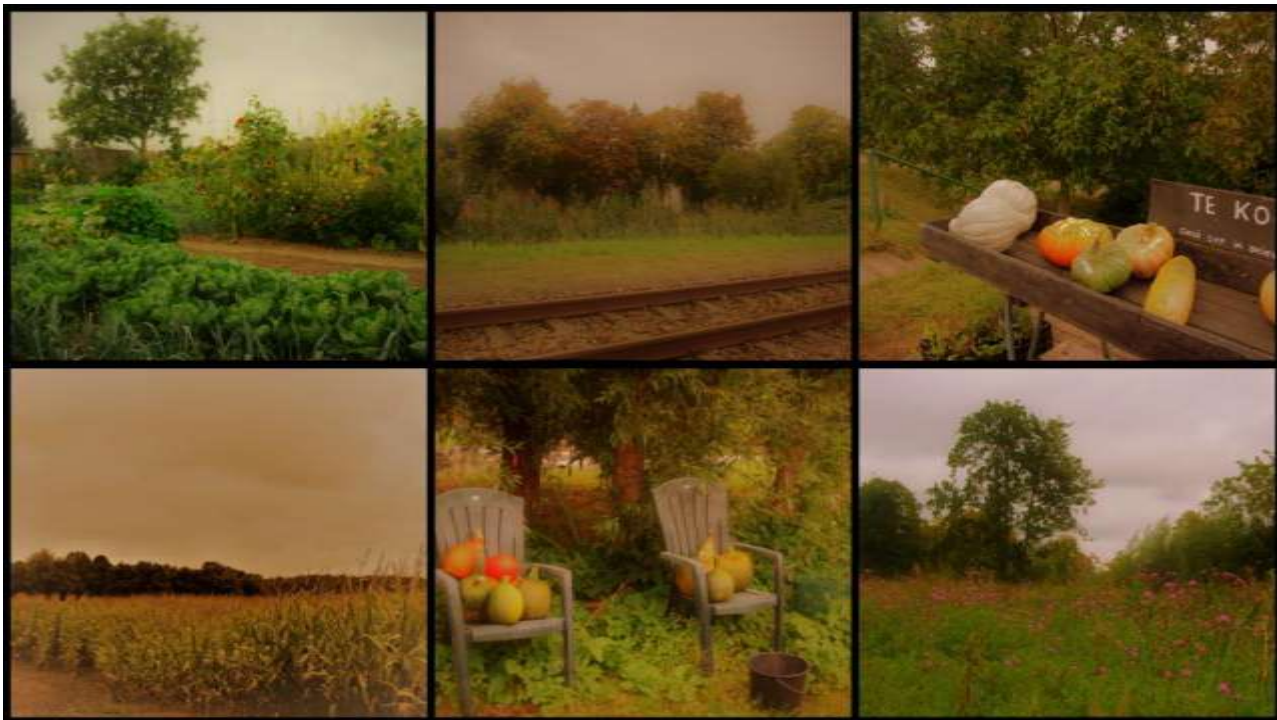
Nazomer-oogst, beginnende verkleuring van het blad en late bloeiers; en dat moois allemaal te zien binnen je eigen dorp.