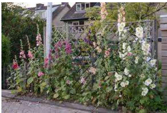
Stokrooszen fleuren het straatbeeld op.

Mocht u er een willen hebben, kunt u die ophalen op Kerkweg 72 (naast het poortje).