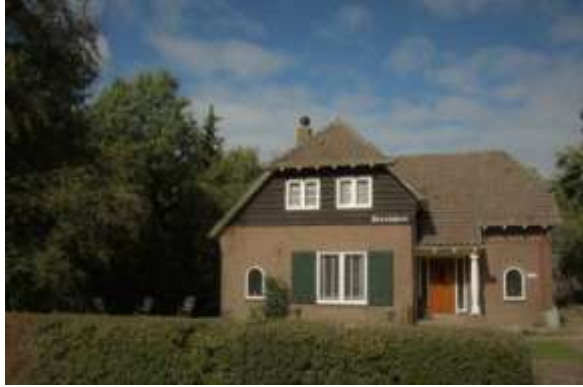
Breedweer, een bekende verschijning in Binnendams