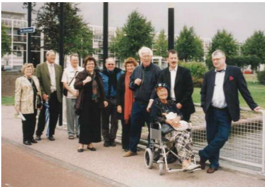
Een uitje naar de wijk Kattenbroek in Amersfoort. Voor de vijver van Emiclaer.

Bij een jubileum hoort ook een terugblik. Een oud-bestuurslid stuurde ons deze foto van het toenmalige bestuur van Stichting Dorpsbehoud tijdens een cultureel uitje in 2003.