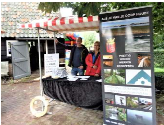
De kraam van Stichting Dorpsbehoud