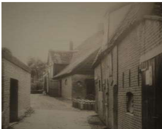
Het boerenerf van De Koperen Knop rond 1970. In het midden een zwik melkbussen.

Als de zon gaat zakken wordt de boordevol geladen wagen door de hoge deeldeuren aan de zijkant van de boerderij naar binnen gereden en de vracht wordt via het rijgebint op de hooizolder gelost. Een waardevolle schat voor de winter geborgen.