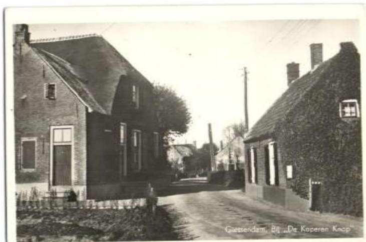
Toen De Koperen Knop nog geen museum was.

Gebouwd als 'een vroeg 17de-eeuwse boerderij van het hallenhuistype' lees ik op Wikipedia. Dat laatste wordt uitgelegd als 'van oorsprong een langgestrekt, driebeukig gebouw met de deel in het midden en de stallen aan weerszijden. In het voorste gedeelte bevindt zich doorgaans het woongedeelte, daarachter is dan de deel met de stallen.'