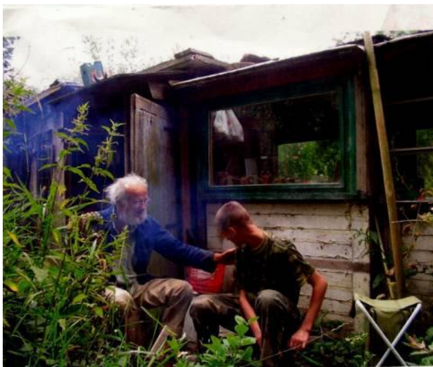
Rien met een bezoeker voor zijn houten huisje .