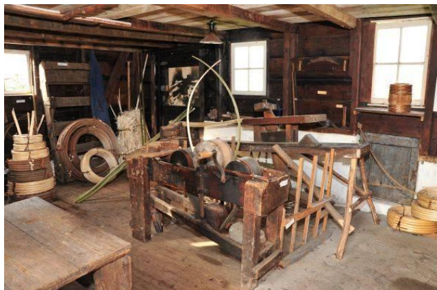
Hoepmakerij uit het begin van de twintigste eeuw.