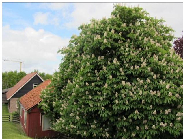
In volle glorie!