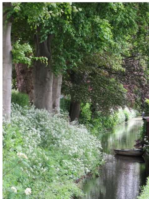
De begraafplaats, omzoomd door natuurlijke kant.