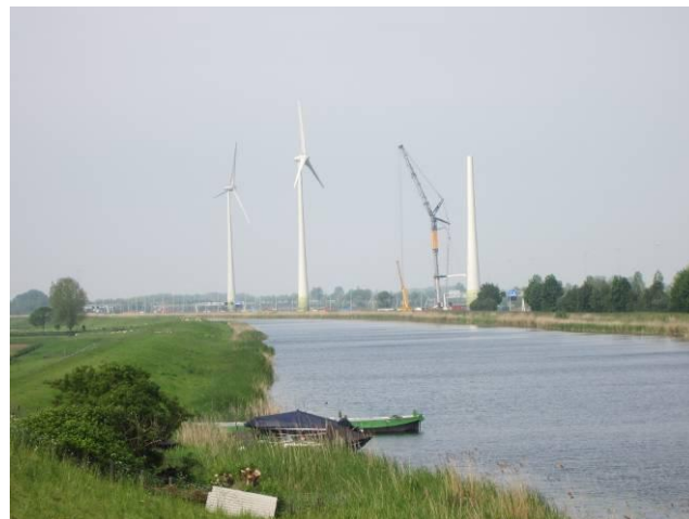
Niet mis te kijken...

milieutechnische oogpunt goed voor de energievoorziening (met de nodige subsidie!), maar verwoestend voor het landschappelijke milieu. Drie poldermodellen op een rijtje. Het zal u duidelijk zijn dat niet iedereen even blij is met deze vernieuwingsdrang van de buurgemeente Giessenlanden.