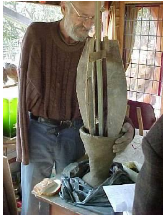
Rien: een echte (levens-)kunstenaar.

jongeman op een baggerschip werkte. Op volle zee, in de buurt van Australië, werd die arm door een ongeluk afgerukt. Maar om nou te zeggen dat Rien