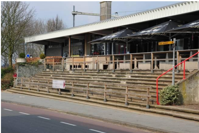
Het juweeltje anno 2013.

Altijd een plaats van komen en gaan, en daarom door vrijwel elke Hardinxvelder wel eens, of dagelijks betreden. Naar school, werk, dagje uit, bezoek halen of brengen: het station vormt daarvan het begin en/of het eind. Er wordt begroet, nagewuifd, bijgepraat, nagepraat en eindeloos veel gewacht... of gerend... Wie heeft er geen herinneringen aan het station?