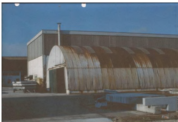
Steeds schaarser in beeld: de nissenhut.