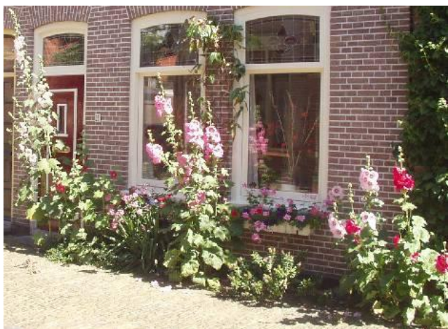
Stokrozen geven fleur en flair!

Deze week liep ik door het oude gedeelte van Amersfoort, hartje stad en verwonderde me erover dat het er zo groen was. Overal waar je keek bloemen, planten, (geleide)bomen en boompjes. Elk mogelijk plekje was benut: blinde muren, lantaarnpalen, bakken, potten op banken en tafels enz. Heel veel stokrozen, die het schijnbaar overal goed doen. Wat een genot voor de zintuigen! Het schijnt trouwens een trend te zijn. Wat mij betreft een hele goede! Ik heb thuis meteen stokrozen gekocht en langs een akelig kale zijgevel van ons huis geplant. Eén of twee stenen uit de bestrating, dat is alles, maar wat een verschil meteen! Het fleurt er letterlijk van op. In Frankrijk zie je, als je een plaats inrijdt, aan het begin een bord met de aanduiding: