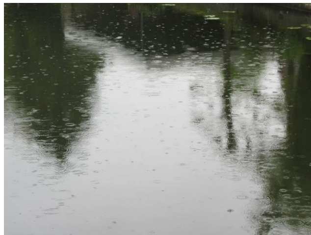
Typierend voor dit voorjaar: regen, regen, regen...

Weer of geen weer: de natuur gaat haar gang!