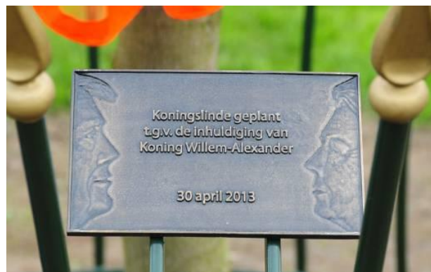
Kroningsboom met hekwerk en tekstbordje.

Het was een prachtige, stralende dag toen de nieuwe koning ingehuldigd werd met zijn koningin. Het hele land vierde uitbundig feest. In iedere stad, ieder dorp wapperden de vlaggen, werden aubades gehouden en kroningsbomen geplant. Zo ook in het dorp aan de rivier. Een mooie koningslinde verhieft trots zijn kroon op een centrale locatie, ter nagedachtenis aan deze bijzondere dag. En dat was niet alles: bij de boom werd tevens een verrassing onthuld! Enkele goede feeën, die bang waren dat de boom evenals zijn voorgangers vroegtijdig gekapt zou worden, hadden zich ingezet voor het behoud ervan. Eén ervan heette 'Dorpsbehoud'. Blij zagen zij toe hoe een keurig, passend hekwerk de boom be-