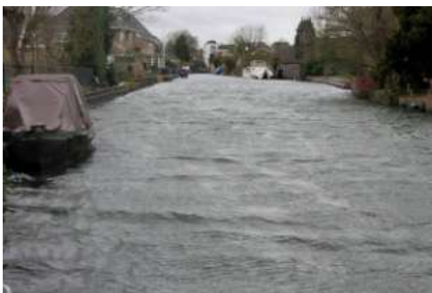
Veel wind en daarom ruw water in de Giessen in januari