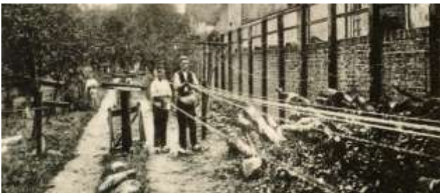
Druk 'in touw'

De touwslager deed zijn werk in de open lucht, overdekt of in een tentachtig geheel, op een touwslagerij of lijnbaan: een soms wel 300 meter lange, smalle strook grond waarboven vele door een spinner aangeleverde garens, werden uitgeschoren (uitgelopen). Het touw kwam terecht in een "kuil", een nog steeds bestaande lengtemaat voor touw. Aan een van de uiteindes van de lijnbaan werden de garens in groepjes aan de haken van een wiel of slagmechanisme (slinger) bevestigd, aan iedere haak een groepje garens. Daar stond ook een teer- en drooghuis.