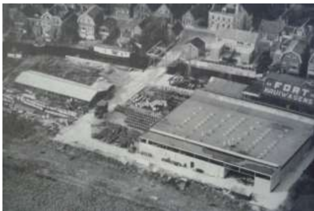
Kruiwagenfabriek Het Fort in oude glorie

In de tachtigjarige oorlog was hier op deze plek in de Peulen een sterkte. Een verdedigingsplaats waar de Spanjaarden het voor het zeggen hadden. Het was waarschijnlijk niet meer dan een versterkt gebouw, maar droeg wel de naam fort. Een verdedigingsbolwerk, een kleine legerplaats wellicht. Zo komt deze plek aan zijn naam. Na de Vrede van Münster stond het er verlaten bij. Het zal door de tand des tijds zijn weggesleten in dit toen nog volop onder invloed van eb en vloed liggend gebied.