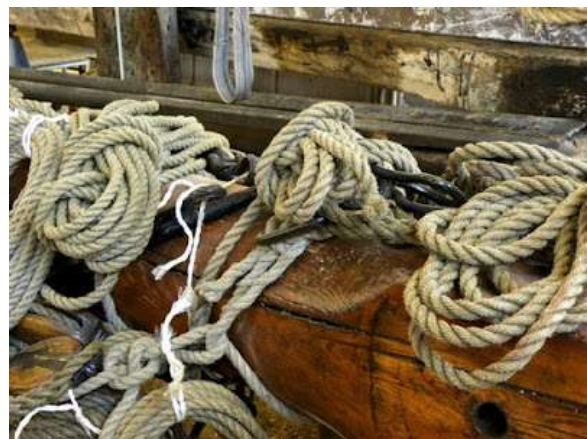
Touw, een ambachtelijk produkt.

Om verschillende touwdiktes te produceren werd het aantal garens per haak vermeerderd. Met enkele van zulke wantslag-touwen kon vervolgens het proces worden herhaald, zodat het mogelijk was om dikke flexibele scheepstrossen te maken, het zogenaamde kabelslag touwwerk. Touw werd volop gebruikt voor de tuigage van zeilschepen. Touwslagerijen kwam men dan ook vooral tegen in havensteden. Veel van deze steden hebben nog steeds straten waarvan de naam aan deze voormalige functie herinnert en daar doet Hardinxveld-Giessendam binnenkort niet voor onder!