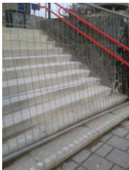
Weer (bijna) als nieuw

Aardig om te weten: bij het open gedeelte tussen de twee trappen werden vroeger de kolen voor de (stroom)treinen gelost.