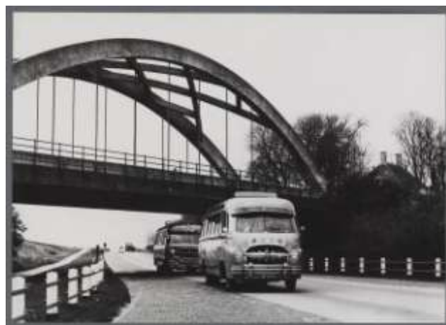
De witte brug alias boogbrug alias Merwededijkviaduct

tonboogviaducten gebouwd. Met een verstijfde buigingsboog en een laaggelegen rijvloer, heet dat in vaktaal. En alle drie kregen ze een naam, in Papendrecht werd het Veerwegviaduct (in de volksmond 'de witte brug'), op Sliedrechts grondgebied Kaaiviaduct en dat bij ons dus Merwededijkviaduct. Het bijzondere aan die laatste is de schuine ligging ten opzichte van de overkruiste rijksweg.