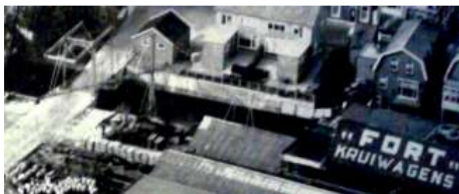
Links de oude brug naar Het Fort over de Giessen

Voor Hardinxveld-Giessendam is het echter over. Daar herinnert niets meer aan wat hier eertijds voor groots werd verricht. Alles is weg. Zelfs de landhoofden van de brug, die het bedrijf voor de aanleg van de Peulen als toegankelijk gebied met de rest van de wereld verbond, zijn voorgoed geschiedenis geworden.