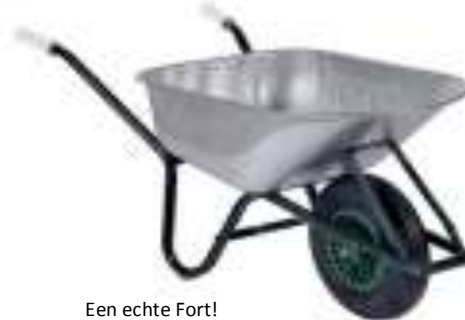
Een echte Fort!

Eind jaren vijftig kocht hij een pers die met één druk op de knop van een plaat staal een kruiwagenbak maakte. Hij kwam daarmee een stap voor op zijn concurrenten. Ongeveer tegelijkertijd met de aanschaf richtte Koorevaar zijn blik richting buitenland. Hij ging naar de beurs en peilde de belangstelling voor zijn product. Hij zocht contact met plaatselijke agenten, die op provisiebasis zijn kruiwagens aan de man brachten.