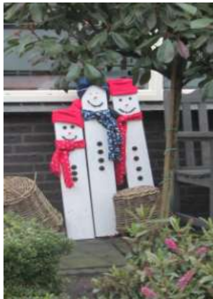
Geen sneeuw? Toch sneeuwpoppen!