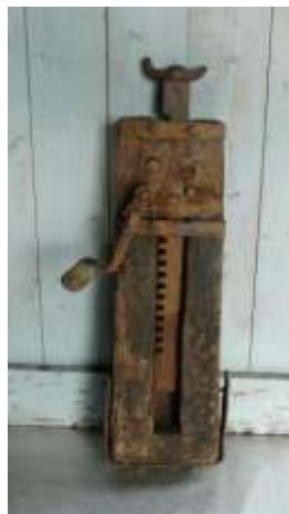
Een ouderwetse kelderwind

vroege voorjaar, zette opa die kelderwind onder de boom en draaide deze zo recht mogelijk. Dan werd er een nieuwe balk onder geplaatst en ging het weer een jaartje goed.