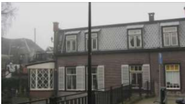
Vanaf het Sluisje gezien.

N.B. Wilt u de oorspronkelijke apotheek uit het doktershuis nog eens zien? Hij is te bewonderen in een museum in Tilburg, waar hij in zijn geheel, met kasten en al, naar toe overgebracht is.