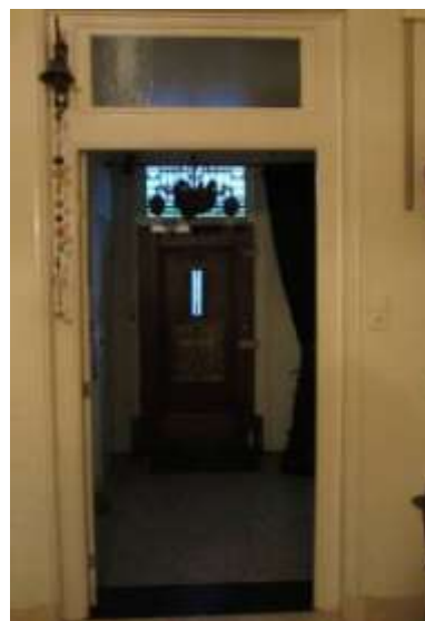
De statige entrée

En dat kamer-na-kamer, zowel boven als onder, is typerend voor het huis, nog steeds.