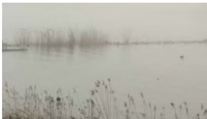
De Merwede bij mist