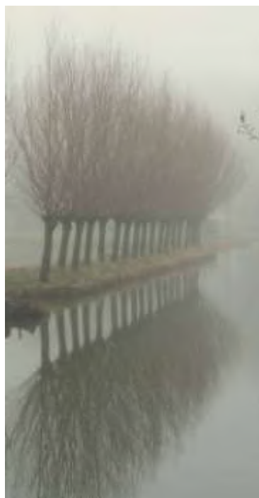
Bomen langs de wetering, achteraan de ijsbaan. Roerloos in de mist.