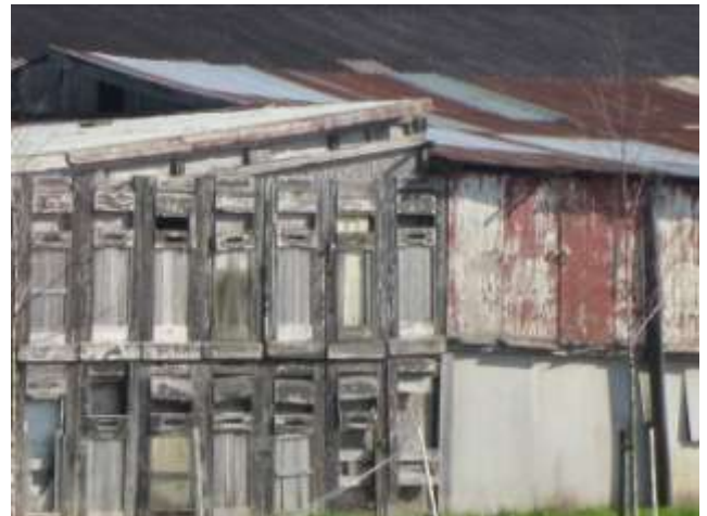
Treffend voorbeeld van hergebruik in Boven-Hardinxveld

Zuinigheid is een deugd. De vorige keer hebben we u al een foto getoond van dit bijzondere schouwspel. Graag komen we er nog even op terug, omdat hergebruik weer volop 'in de mode' is. Een van de positieve gevolgen van economisch slechtere tijden is dat mensen gaan nadenken. Nadenken over hoe ze zuiniger kunnen omgaan met wat ze hebben. Dat dit eertijds heel gewoon was, blijkt uit die foto. Hierbij nog een keer het zelfde schouwspel, maar dan in breder perspectief.