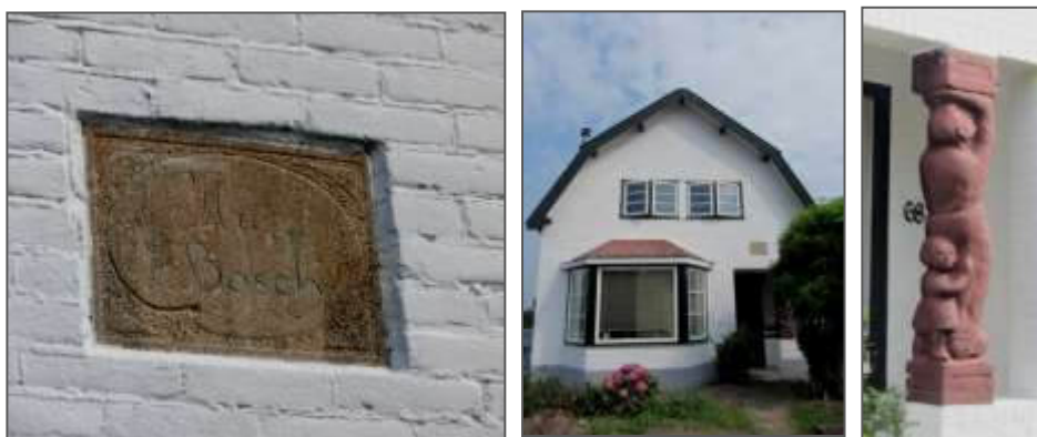
Onopvallend en moeilijk te lezen, maar het staat er toch echt: Huize't Bosch.

Bovendien lijkt het een wat misplaatste naam in de omgeving. Bosrijk zou je die niet direct willen noemen. Toch, nog niet heel lang geleden, stond een paar honderd meter achter het huis, een klein bosje van populieren. Daarin verscholen een gebouwtje van de waterzuivering. Een lommerrijk plekje, maar een bos...? Zouden hier ooit meer bomen gestaan hebben? Wie het weet mag het zeggen!