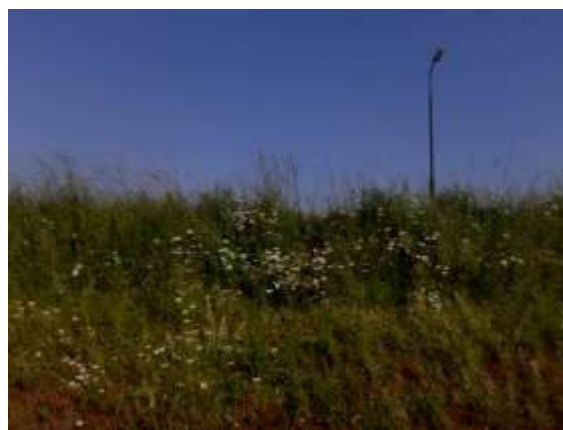
Zomer in en rond ons dorp!