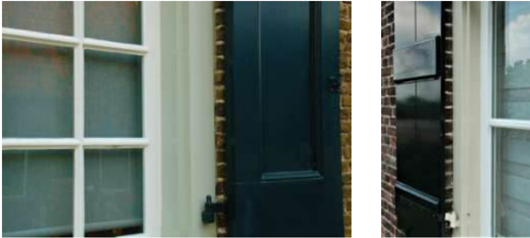
Voorbeelden van Bentheimer in ons dorp, o.a. bij Museum De Koperen Knop.

Tegenwoordig zijn de kozijnen zo licht van kleur dat dit niet meer Bentheimer genoemd mag worden maar eerder grauwwit, roomwit of gebroken wit.