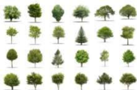
Welke boom kiezen we in onze tuin?