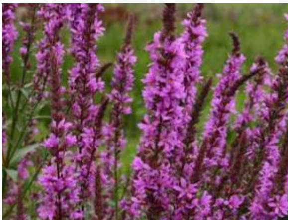
Inheemse plantensoorten fleuren de tuin en omgeving op