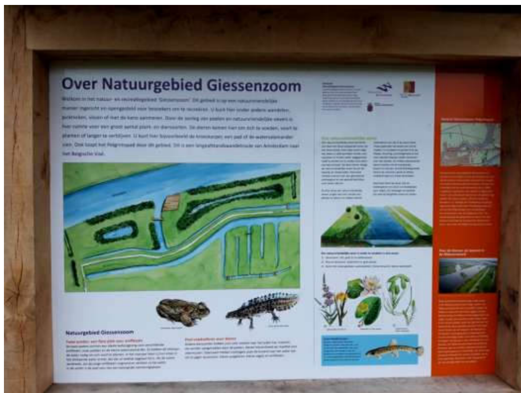
(Toeristisch) informatiebord in Hardinxveld-Giessendam aan de Giessenzoom. Zie en kijk!