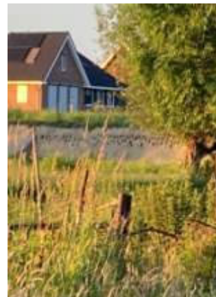
Vakantie-accomodaties in De Blauwe Zoom