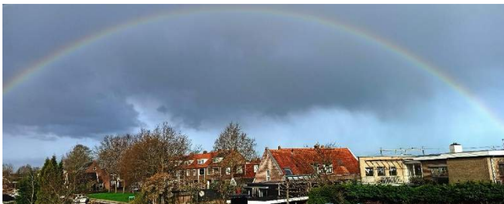
Regen en zonneschijn boven de Damstraat.