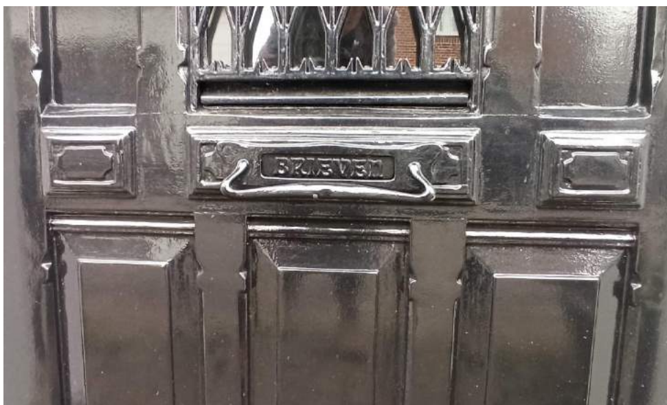
De brievenbus met kenmerken van de Jugendstil.