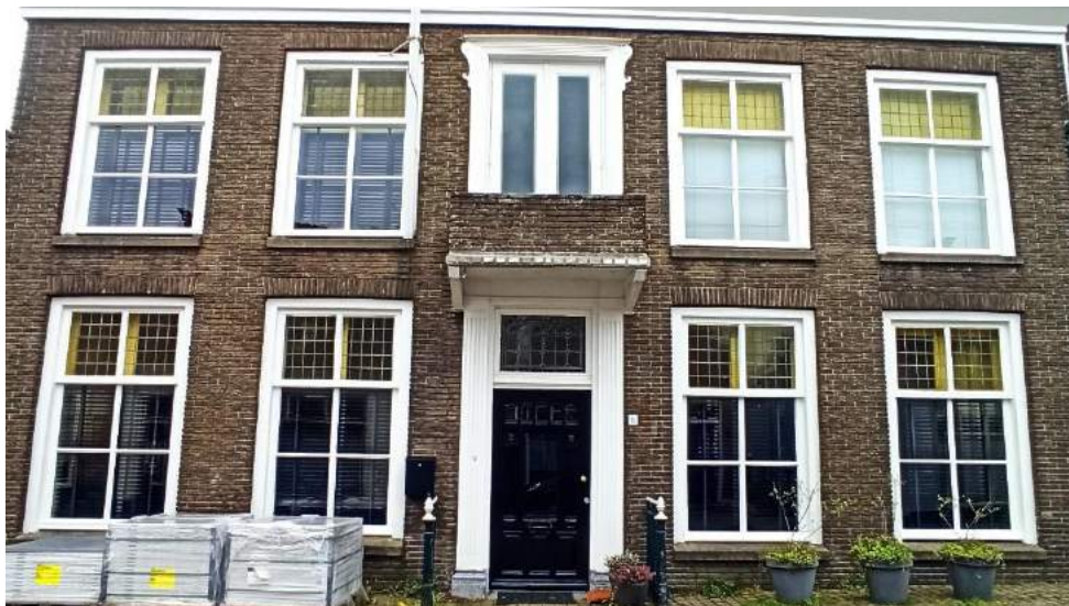
Buitendams 11, een waardevol pand.

Een voornaam pand in wat vroeger het 'bruisende hart' van Giessendam was. Hier in de buurt waren diverse winkels gevestigd, zoals een stoffenwinkel, de sigarenwinkel van de gezusters Monteban, een groente- en fruitwinkel, bakkerij, graanmolen en een herberg. Het pand nummer 11 was van oorsprong de woning van de schout (burgemeester). Later hebben hier diverse huisartsen praktijk gehouden. Oorspronkelijk had dit pand een andere, oudere gevel. De gevel die we nu zien, is dus niet de originele, maar er later voorgezet. Hij is uit het Jugendstil-tijdperk, zo rond 1900. Aan de brievenbus zijn de kenmerken van die stijl te zien. De losse garage iets verderop getuigt ook van de rijkdom van de vroegere bewoners.