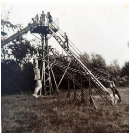
Speeltuin 't Weitje in de jaren '60/'70.

Fragment uit het onlangs bij de Historische Vereniging verschenen boekje 'Met mevrouw Króó-oon' van Liesbeth Leenman-Kroon en Jolijn de Rooij-Kroon.