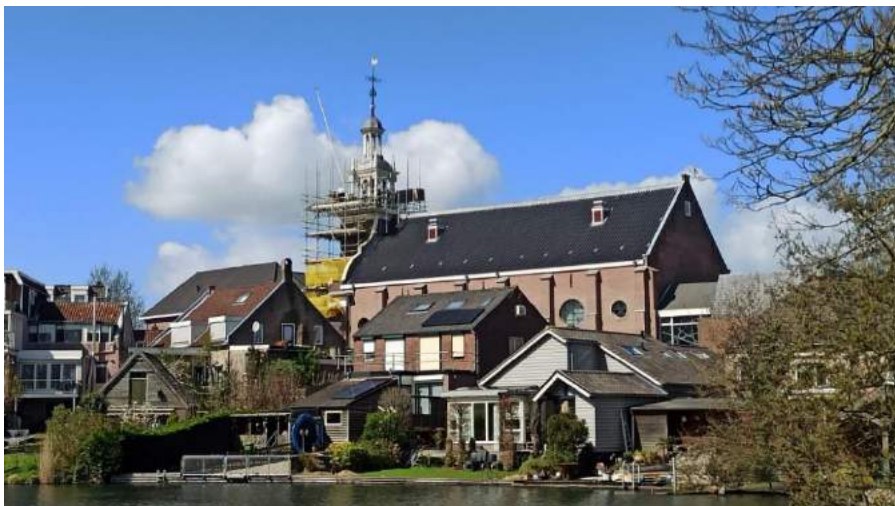
De kerktoren wordt ingepakt voor restauratie

In 1798 heeft keizer Napoleon Bonaparte wettelijk bepaald dat alle bestaande kerktorens in Nederland eigendom werden van de burgerlijke overheid. De torens moesten een militaire functie krijgen als uitkijkpost. Vreemd genoeg is de kerktoren in – toen nog- Hardinxveld daar buiten gevallen en daardoor nog steeds eigendom van de kerkelijke gemeente. Een kostbaar bezit! Zeker gezien de kosten van de restauratie! Het is te hopen dat de benodigde financiën bij elkaar gekregen worden, zodat ‘het gezicht van ons dorp’ de komende jaren die functie hernieuwd kan vervullen!