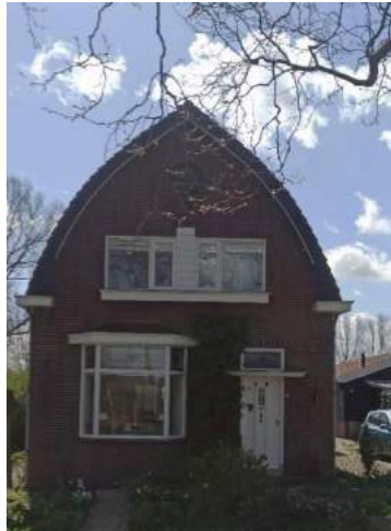
De opvallende verschijning van Parallelweg 60

met gemetselde borstwering en dak met leien. Al met al een huis, wat de moeite van het bekijken waard is; een pareltje met een eigen karakter in zijn groene omgeving!