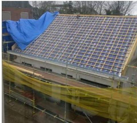
Toen Achterdijk 4, nu in de 'cocon' voor een tweede leven