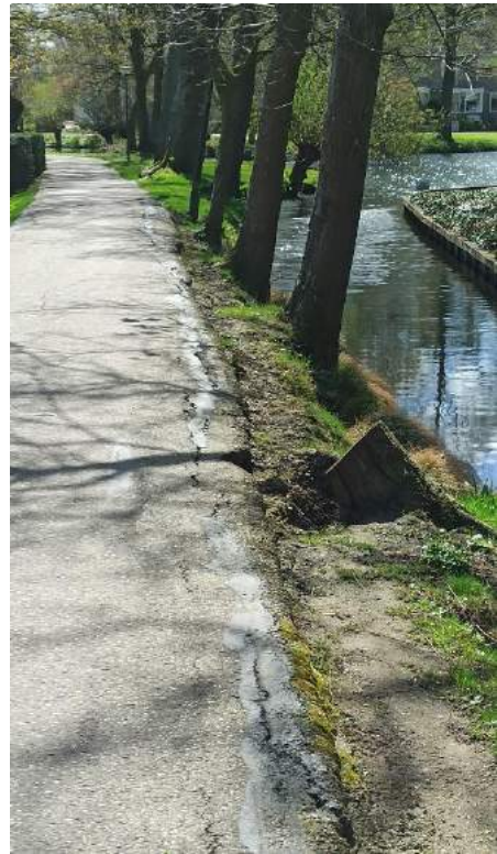
Het Laantje nu: een gevaarlijke situatie!