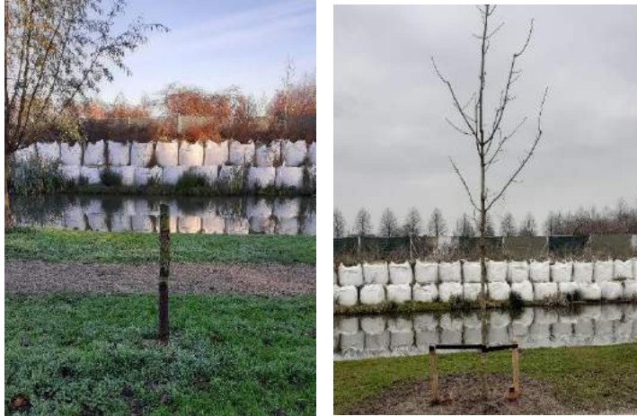
Nieuwe aanplant na vandalisme. Op de achtergrond de zakken met zand die tijdelijk de grond er onder in laten klinken.

De hondenuitlaatstrook bij Het Laantje ter hoogte van de bibliotheek. Een groene strook met bomen. In november maakte een van onze bestuursleden melding bij de gemeente dat er 2 exemplaren waren afgezaagd. (Wie doet overigens zoiets?) Tot onze vreugde constateerden we dat, zoals te zien, er sinds kort weer (3!) nieuwe bomen aangeplant zijn. Hulde aan de gemeente dat zij dit heeft aangepakt!