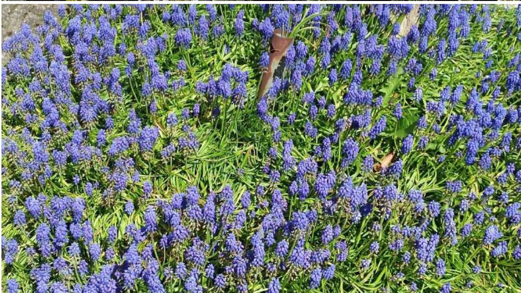
De natuur in april : ook ons dorp is vast voorbereid op Koningsdag