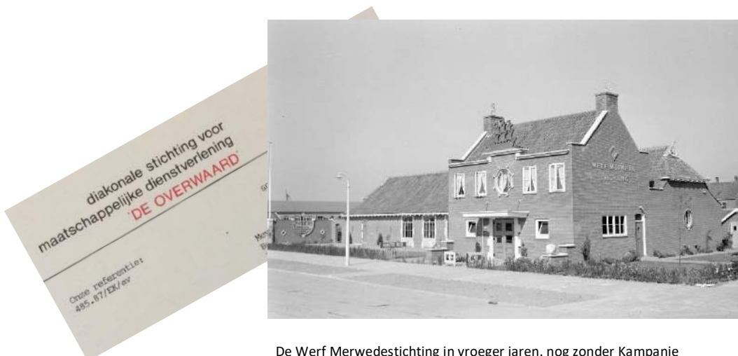
De Werf Merwedestichting in vroeger jaren, nog zonder Kampanje

N.B. van de redactie: tot onze vreugde worden er stappen ondernomen om de 'Werf De Merwedestichting' een monumentale status toe te kennen.