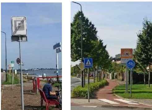
Door de borden het verkeer niet meer zien

Zoals bij het bord met de poepende hond; daarvan bestaan er inmiddels al 30. Wie er op let, kijkt met andere ogen! Ook in ons dorp.