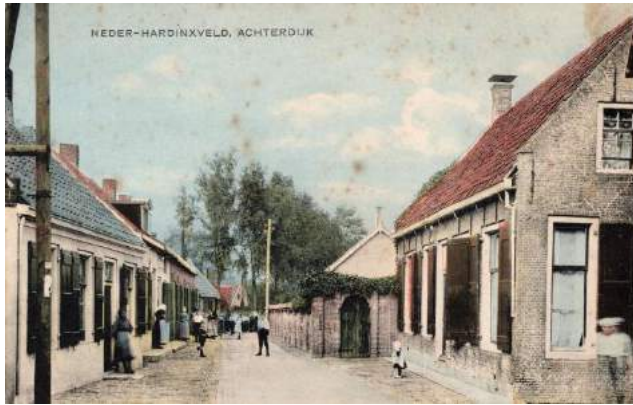
Op deze foto van de vroegere Achterdijk flankeren de bomen op de achtergrond het laantje naar De Koepel.

Zó, dat dit fraaie weggetje een blijvend 'groene long' van ons dorp blijft, waar het heerlijk gaan en komen (of wonen!) is.