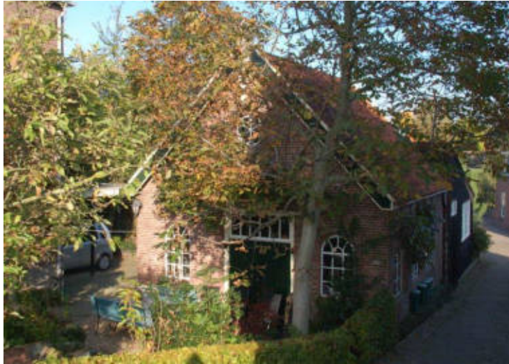
Buitendams 298, het bekijken waard!