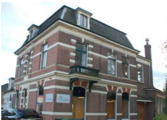
Monumenten, kunstwerken: cultuur 'om de hoek'!