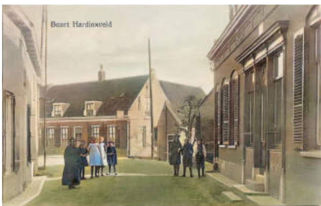
Het verleden en mooie dingen ontdekken tijdens een erfgoedwandeling

Een schat ligt meestal niet voor het oprapen; meestal moet je moeite doen die te ontdekken. Zo is het ook met de schat aan cultureel erfgoed die ons dorp rijk is. Je loopt er -letterlijk- zó aan voorbij. Wie de moeite neemt, kan echter ontdekken dat er nog een hele culturele erfenis is. Tijdens de erfgoedwandelingen die Stichting Dorpsbehoud samengesteld heeft, gaan je ogen open voor de rijke historie, architectuur enz. van ons dorp. Er zijn twee wandelroutes: Boven- en Beneden Hardinxveld. Ze zijn te downloaden via onze website www.dorpsbehoudhg.nl (onder 'Wat doen wij?'). Ook is het mogelijk met een groepje een wandeling te maken onder leiding van een gids van onze stichting. Leuk als seizoensafsluiting van uw club, vereniging o.i.d.! Inlichtingen en boekingen: tel.0184-612232. Voor kinderen is er de Kunst-en cultuurroute 'Kijk eens rond', inclusief vragen-/opdrachtenformulier. Zie onze website. Buitengewoon boeiend en verrijkend!