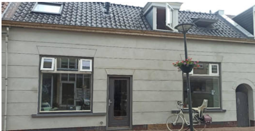
Een mooi voorbeeld van vernieuwing in ‘een oud jasje’ in de Peulenstraat