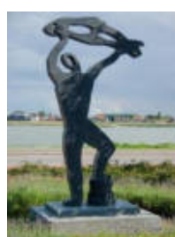
'De drie zalmen' van Marcus Ravenswaaij en 'Man met Vis' van Steef Roothaan