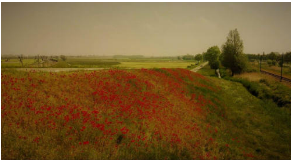
Uitbundige kleurenpracht, midden in het dorp en net erbuiten