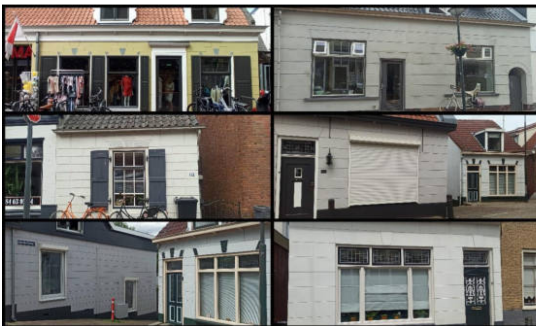
Een klein rondje door de Peulenstraat/Buitendams levert al een mooie 'buit' aan gevels met gestuct blokpatroon.

Tegenwoordig wordt het toepassen van schiften/blokkenpatroon uit monumentaal oogpunt soms zelfs geëist.