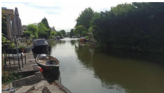
De Giessen achter de Kerkweg rond 1955 en nu