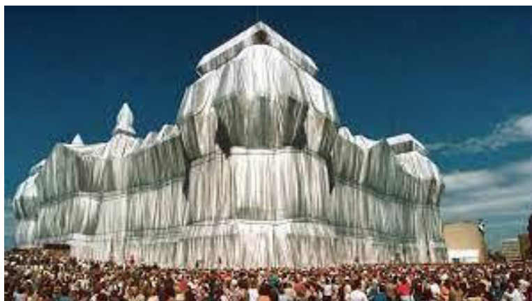
Kunstwerk van Christo

Na zijn dood ging het project verder en werd in 2021 de Arc de Triomphe in Parijs ingepakt. Ook heeft deze inpakkunst navolging gekregen op veel andere plaatsen, echter veelal in minder groteske vorm. Ook Nederlandse gebouwen zijn zo tijdelijk ingepakt geweest.