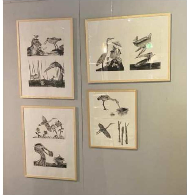
Expositie 'Vogels in trek': zowel kunstzinnig als informatief. Het bezoeken waard!