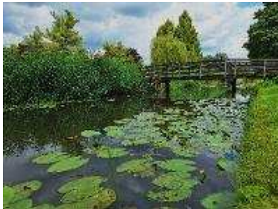
Water: vitaal onderdeel van ons dorp