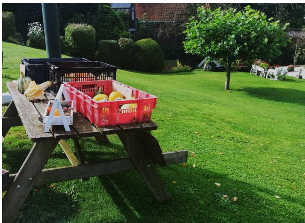
De oogst is binnen in Buitendams