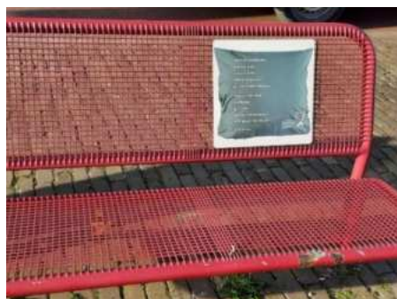
Bankje met 'kussen' bij het pontje in Boven-Hardinxveld

Inmiddels zijn de voorbereidingen voor een tweede serie van vijf 'kussens' aan de gang. Hopelijk kunnen die binnen afzienbare tijd geplaatst worden.