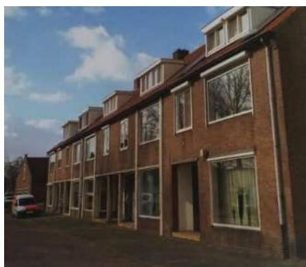
De voormalige winkelgalerij aan de Damstraat: eigenlijk heel interessant!

Wat leert men hieruit? Dat een ietwat saai ogend rijtje huizen zomaar heel interessant blijkt te zijn!