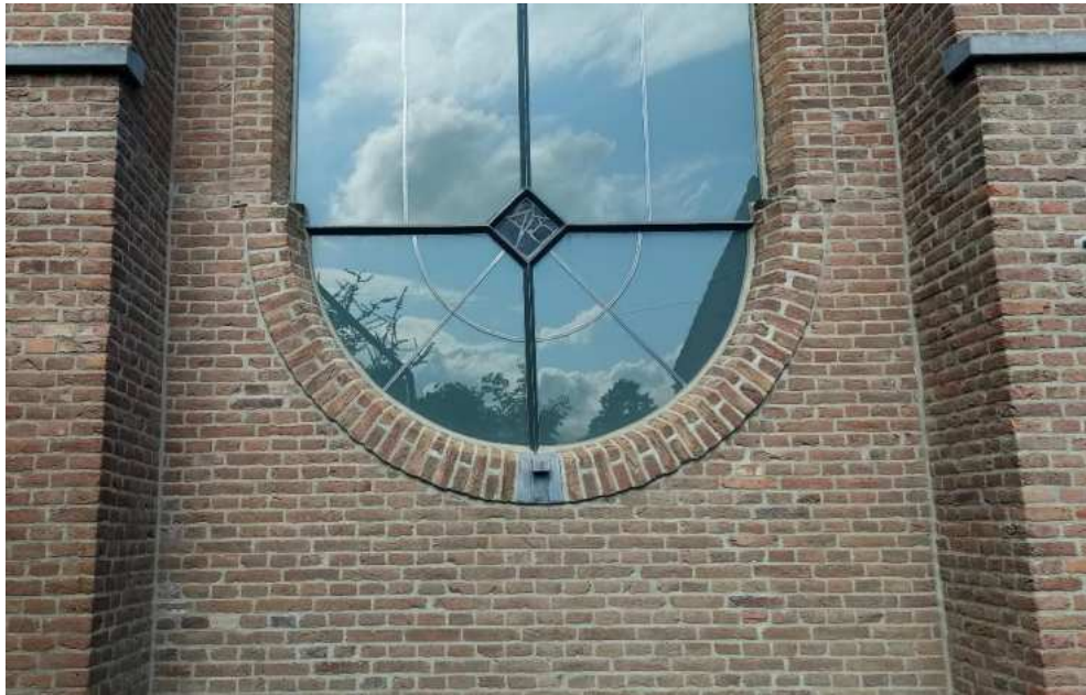
De Hervormde kerk in ons dorp. Twee voorbeelden van verschillende voegen, aan de Peulenstraat- en de Kerkwegkant Bovenste foto: snijvoeg, onderste foto: platvol doorgestreken geborstelde voeg