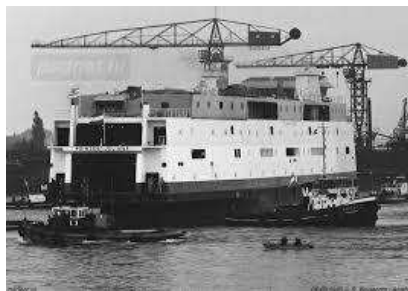
Jarenlang een vertrouwd beeld in ons dorp: hijskranen op een scheepswerf

Op het bedrijfsterrein van - thans - Neptune Shipyards, voordien het werfsterrein van Merwede Shipyards, stonden ook twee van die torenkranen. Markante kranen, zoals deze van oudsher op scheepswerven voorkomen. Met een lange hijsarm om zover mogelijk over een schip te kunnen reiken en voorzien van een rond betonnen contragewicht achter het zogenaamde machinehuis.