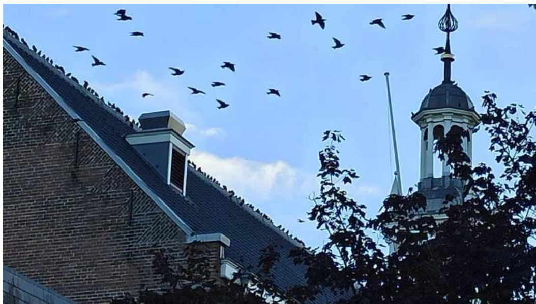
Vergadering van spreeuwen op de nok van de Hervormde kerk, vóór de wintertrek.