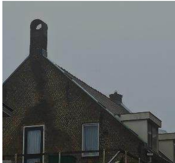
Bijzondere schoorstenen uit de jaren '60 (links) en die van de oude bakkerij in de Peulenstraat (rechts) Let ook op de kap!