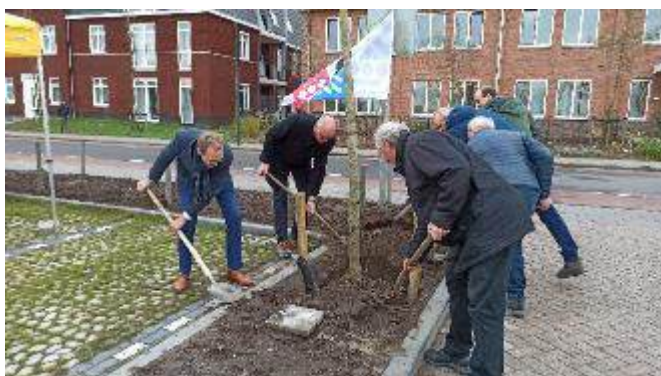
Raadsleden dragen hun steentje, c.q. schepje, bij aan een groener dorp

De Stichting Dorpsbehoud mocht adviserend betrokken zijn bij de plannen en was daarom ook bij de feestelijke aanplant van de bomen aanwezig. Een heuglijk feit!