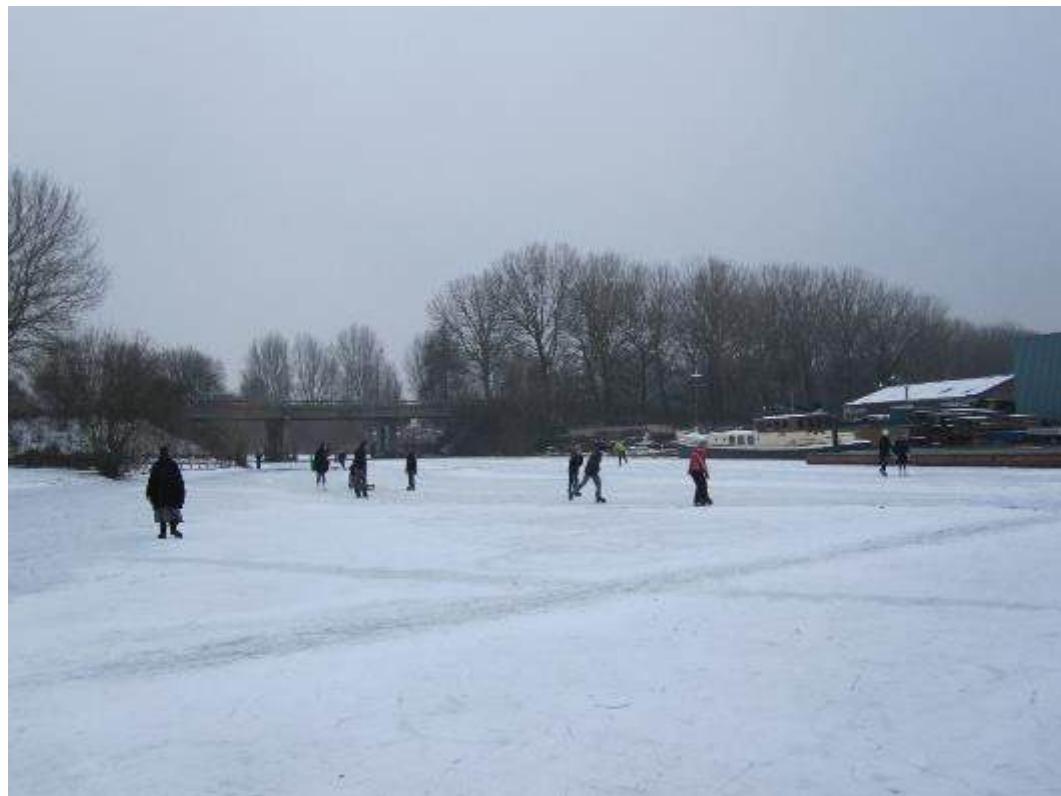
Mooie winterse beelden uit vroeger jaren