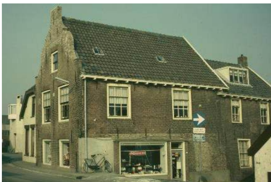
Schoonheid uit het verleden, waard om te koesteren