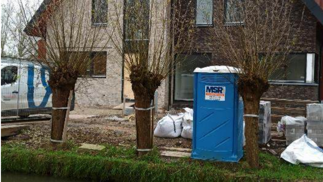
Mooie combinatie van oud en nieuw aan de Parallelweg