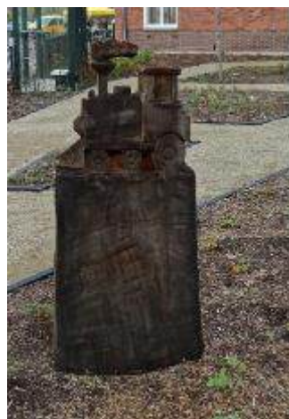
Uit oud (platanen)hout gesneden