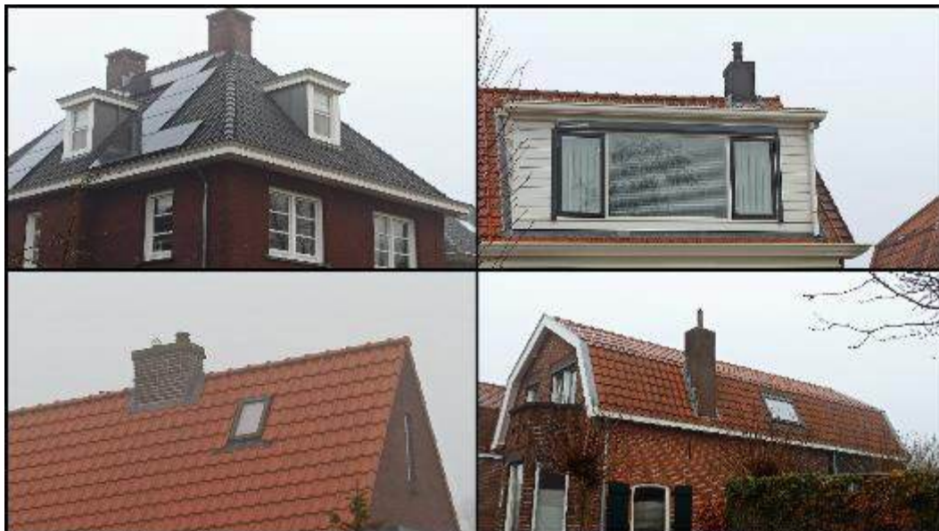
Op de Kerkweg: voorbeelden van oude en nieuwe schoorstenen, voor een enkel of dubbel rookkanaal

Een echt winters onderwerp deze keer: schoorstenen. Hoewel tegenwoordig beladen, het zien van een rokende schoorsteen roept onlosmakelijk een beeld op van warmte, huishoudelijkheid in de koude periode van het jaar. Hoewel... het zien van 'echte', gemetselde, rokende schoorstenen is geen vanzelfsprekendheid meer in het straatbeeld. Vooral nieuwbouwhuizen volstaan met een functioneel, maar weinig decoratief rookkanaal in de vorm van een simpele pijp op het dak of elders.